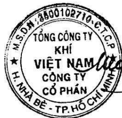
Dương Mạnh Sơn